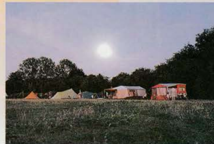
Camping De Roos.

binnen en we brachten het er zeer wel levend vanaf, het was zelfs heerlijk. In een prettige sfeer kun je jezelf in de boerderij of in de tuin te goed doen aan zoete en hartige pannenkoeken.